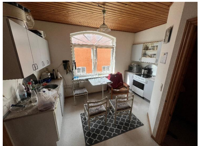
Nørregade 26, 1.tv.